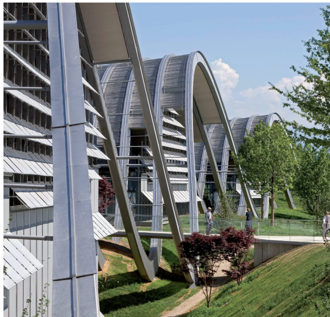
Zentrum Paul Klee, Suisse Renzo Piano Building workshop En collaboration avec ARB (Bern) Réalisé avec les nuances 304, 316L d'aspect Uginox Top